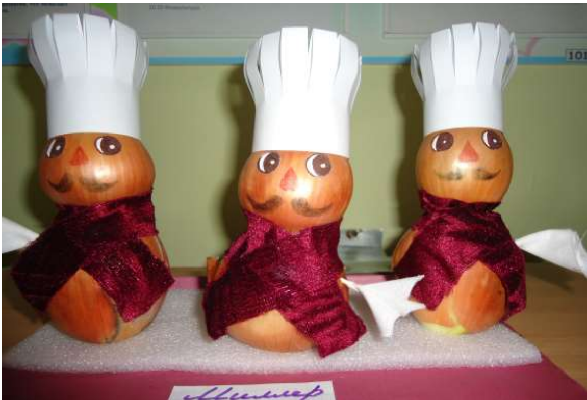
Участник № 43