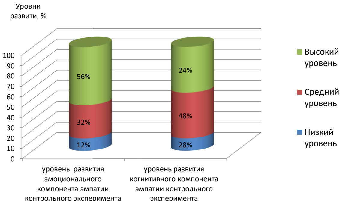
Рис. 2. Уровни развития эмпатии у старших дошкольников по результатам контрольной диагностики.